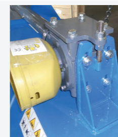
Fissaggio scatola ingranaggi robusto e di facile regolazione