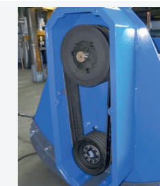
Trasmissione con pulegge di grandi dimensioni