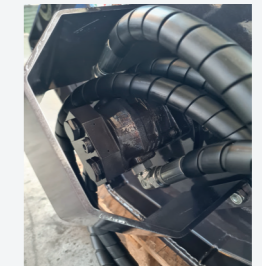
Motore idraulico in ghisa con anticavitazione integrata