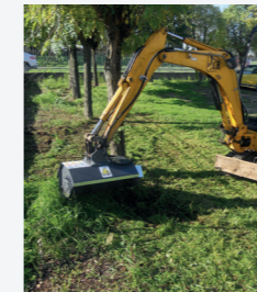
Utilizzo facile e sicuro